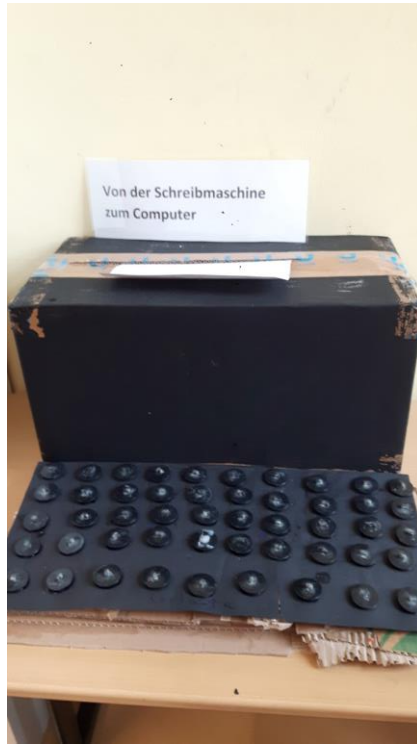
Von der Schreibmaschine zum Computer