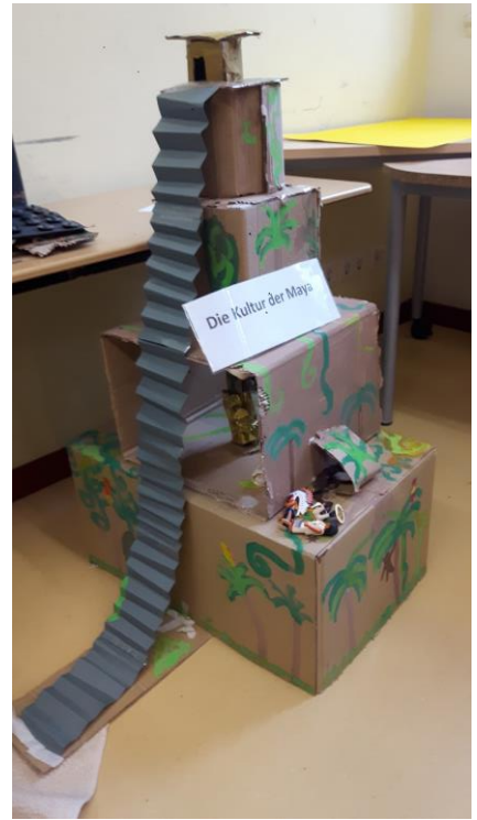
Die Kultur der Maya