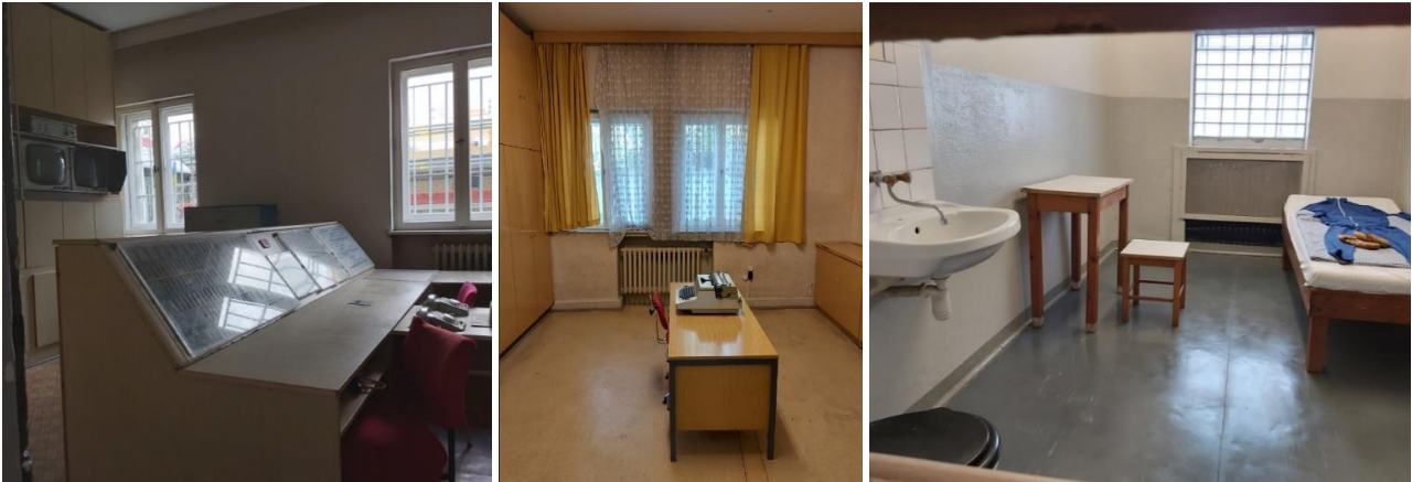
Abbildung 2: Einblicke zu unserem Besuch des ehemaligen Stasi-Gefängnisses in Hohenschönhausen.