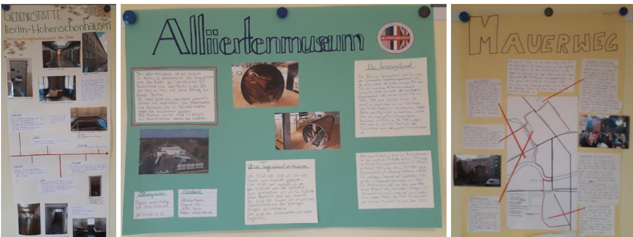
Abbildung 4: Einige unserer Lernplakate für die Präsentationen der Humboldtwoche.