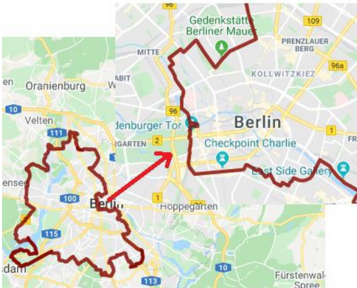
Abbildung 1: Unser Mauerwegspaziergang (Quelle: https://www.berlin.de/mauer/mauerweg/stadtroute/nordbahnhof-potsdamer-platz/ , Zugriff 14.01.2019 um 11:25 Uhr).

Am Donnerstag bekamen wir Zeit unsere Eindrücke der Woche festzuhalten und haben zu einem unserer Ausflüge Plakate oder Präsentationen erstellt, die wir am Freitag präsentierten.